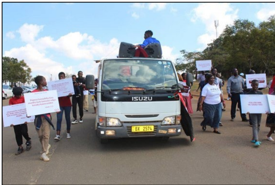
Campagne d'évangélisation des jeunes de la ville de Lilongwe

En tant que mouvement de Jeunesse pour Christ, nous poursuivons notre vision d'atteindre tous les jeunes d'Afrique et de nous joindre à ceux qui ont la même mission que nous pour nous aider à nous rapprocher de notre vision. Les leaders chrétiens, les organisations, les mouvements et les ministères en Afrique ont réaffirmé leur engagement à apporter l'Évangile à toute l'Afrique, déclarant une décennie d'évangélisation jusqu'en 2033.