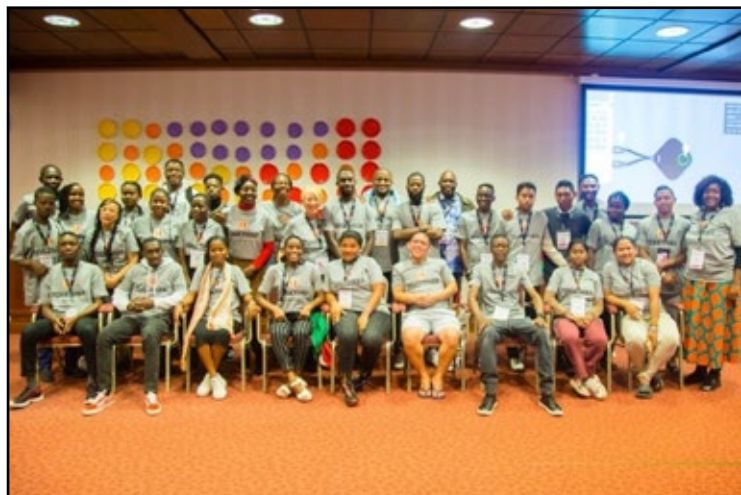
Jeunes catalyseurs à l'AG 2023

Que la grâce de notre Seigneur et Sauveur Jésus-Christ soit sur vous ! C'est avec une joie sans bornes que nous vous adressons nos salutations les plus sincères dans cette édition du Catalyst, nous réjouissant des témoignages inspirants et des profondes transformations apportées par le travail dévoué de nos départements dans toute la zone Afrique.